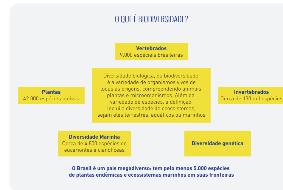
Figura 1.2. O termo biodiversidade surgiu inicialmente no contexto biológico, mas ganhou dimensões variadas, vinculando espécies a múltiplos valores, tais como cultura, economia, saúde e lazer (adaptado de Pereira et al. 2013).

A biodiversidade também é uma construção social e, nesse sentido, vários estudos têm proporcionado bases teóricas sólidas para a compreensão das relações entre diversidade cultural e biológica e de sua relevância para a manutenção desses sistemas (Posey 1982, Neves 1992, Cunha 1999). Os conhecimentos e o papel de populações tradicionais com relação a sua biodiversidade são hoje reconhecidos na CDB. A cada dois anos, dirigentes e cientistas reúnem-se para compartilhar avanços, debater fragilidades e propor metas que visem a implementação efetiva das diretrizes da CDB.